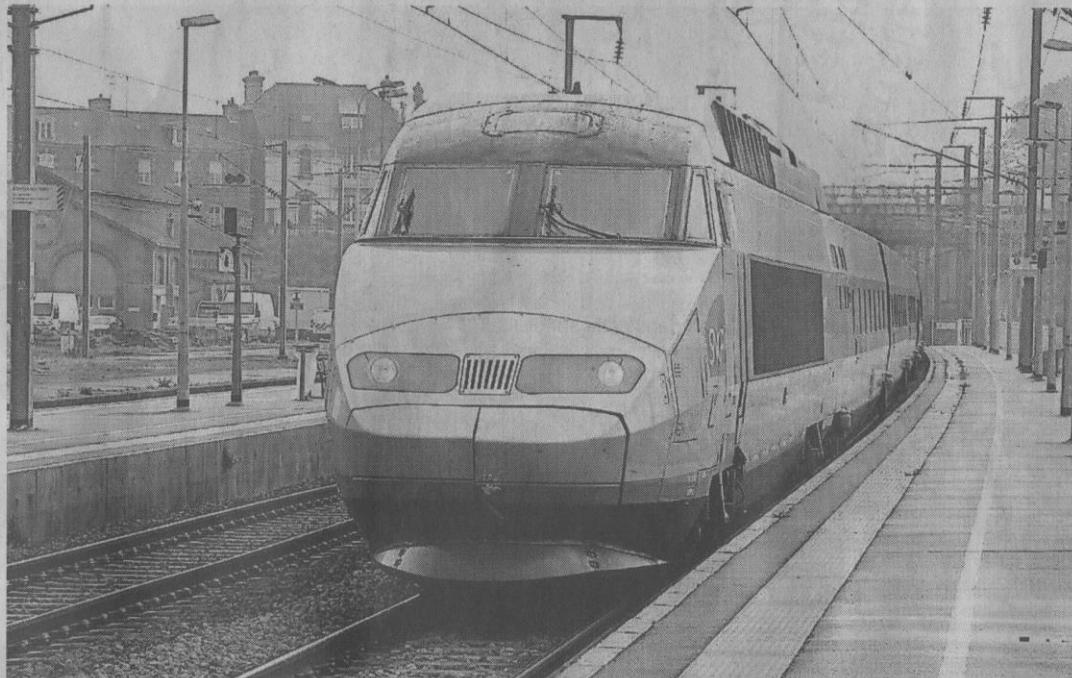
Le TGV en gare de Lamballe.

Il est également demandé la réalisation des travaux d'aménagement du giratoire Sud, dans le même Contrat de plan État-Région (CPER). Les élus ont approuvé à l'unanimité cette proposition, avec les clés de répartition de financement.